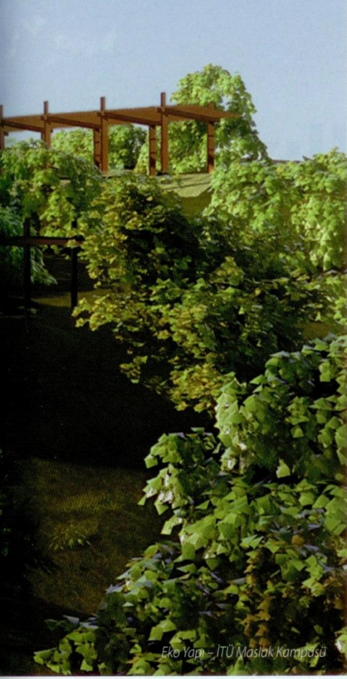
Eko Yapı - İTÜ Maslak Kampüsü

mühendislik ekipleriyle birlikte, her projemiz için bir ekolojik maliyet tablosu çıkarıyoruz. Bu tabloda, ilk yatırım maliyetleriyle birlikte, yıllar içinde yatırımın geri dönüş hızı da bulunuyor. İşverenler yeşil tasarım ile kazanabileceklerini birebir görerek bilinçli karar verebiliyor.